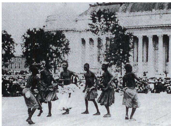
Pigmeos bailando en la Exposición Universal de St. Louis, 1904