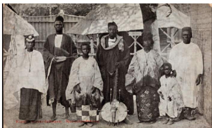
Africanos en la exposición “Vila Congo”, 1914

Con motivo del primer centenario constitucional, un pueblo exposición conocido como “Kongolandsbyen” (o “Vila Congo”) fue exhibido en el 1914 durante cinco meses. El propio rei de Noruega ofició la inauguración. Vivieron allí 80 personas de origen africano, la mayoría de Senegal, y reproducían usos y costumbres africanos.