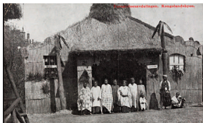
Exposición “Vila Congo”, 1914

Hoy en día existe una controversia en referencia a una exposición actual en Oslo, que intenta reproducir