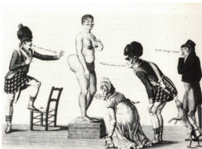
Hottentot Venus, siglo XIX (Autor desconocido)

Saartjie Baartman nació en el 1789 en Sudáfrica. Originaria del pueblo khoikhoi, conocido como hottentot (término usado despectivamente, que significa tartamudo en holandés), fue llevada a Londres en el año 1810, a los 21 años de edad.