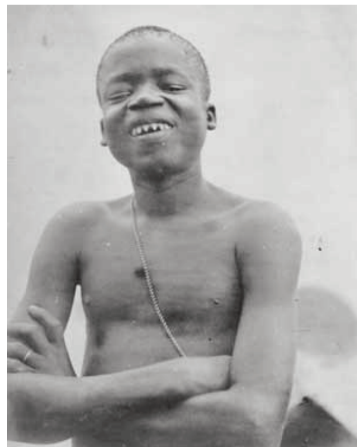
Ota Benga, 1904

Madison Grant, un científico racista y eugenista, conjuntamente con el conservacionista y director del mismo zoológico, William Hornaday, planearon una forma de promocionar el “racismo científico”. Decidieron exponer a Ota Benga junto con un orangután, formando parte de la “Casa de los Monos”. Benga se hizo famoso como “El Eslabón Perdido”, concepto por el cual quería hacerse entender que el africano se encontraba en una posición a camino entre el mono y el hombre.