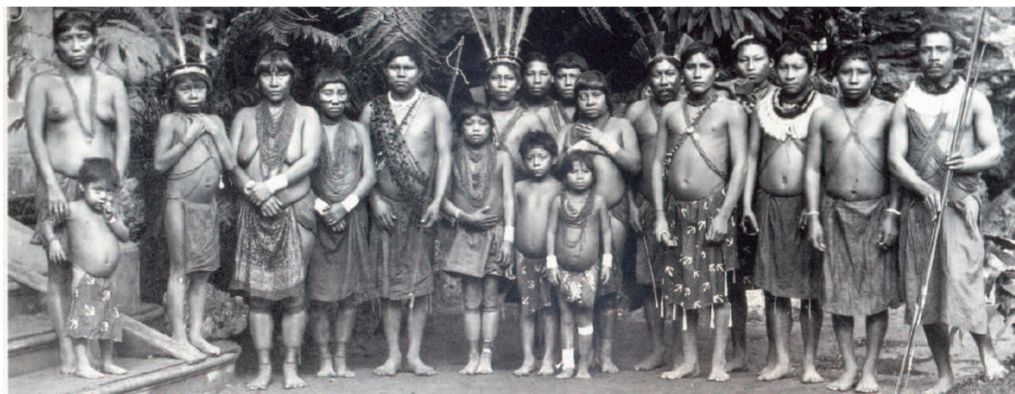
Indígenas Kalina, París, 1892 (Autor: Prince Roland Bonaparte)

Fueron muchos los casos de nativos expatriados a la fuerza durante las últimas décadas del siglo XIX, y primeras del siglo XX, con la finalidad de ser exhibidos en el mundo occidental. Pero de todos estos, nos ha llegado un legado de dos casos que han estado documentados a partir de dos álbumes de fotografías del príncipe Roland-Napoleon Bonaparte y que se encuentran en la “Bibliothèque Nationale Française”, a París. En estos libros se encuentran, como muestrarios humanos, diversas fotografías de nativos chilenos forzados a hacer gira europea: 50